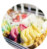
HTF Pro 8