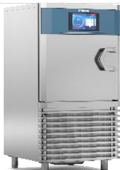
MF NEXT M