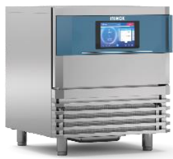
MF NEXT S