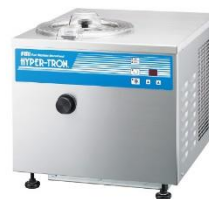
ハイパートロンミニ