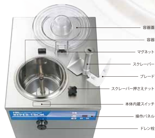
容器蓋 容器 マグネット スクレーパー ブレード スクレーパー押さえナット 本体内蔵スイッチ 操作パネル ドレン栓

蓋に取付けられたマグネットと本体内部に組み込まれたマグネットスイッチで、蓋が正しい位置にセットされていないと作動しない安全設計です。また、操作部は完全防水のタッチパネル仕上げです。機械の中に水が入り込む心配がないので、安心して操作できます。