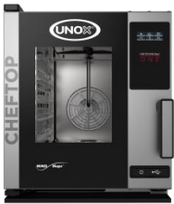
UNOX / XV-206ONE(予定)