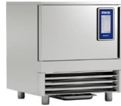
IRINOX / MF25.1T

温度・スチーム・ファンスピードをマインドマップでシェフの感覚をダイレクトにマシンへ。曲線で描いた設定を忠実に再現する新しい機能を是非会場で。