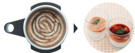
魚の小骨も完全に粉砕